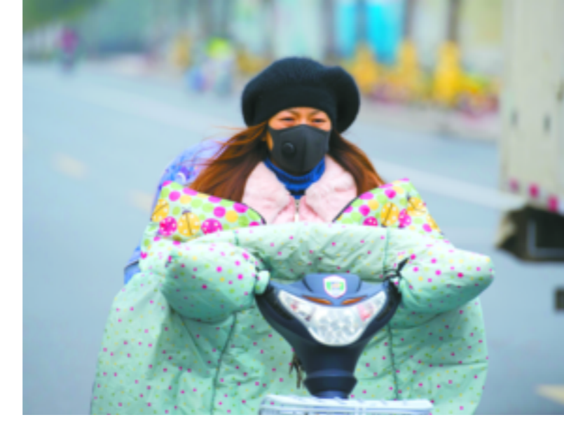
昨天,上海发布寒潮蓝色预警。图为骑车人“全副武装”。

截至2016年底,本市60岁及以上户籍老年人口457.79万,占户籍人口的31.6%;65岁及以上老年人口299.03万人,占20.6%。人口老龄化伴随着高龄化,截至2016年底,80岁及以上老年人口