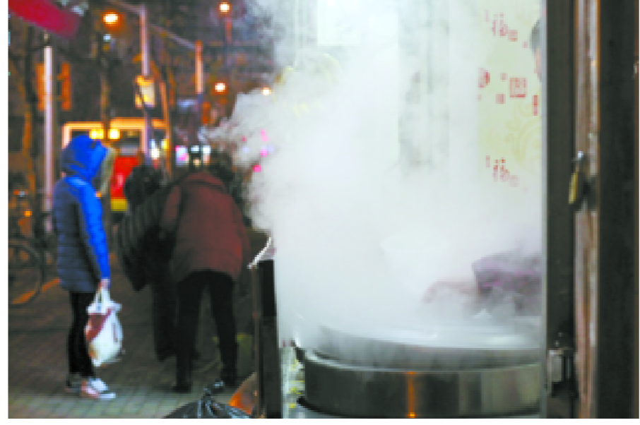
受强冷空气影响,气温跌破冰点。锅里散出的热气,为行人带来一丝温暖。